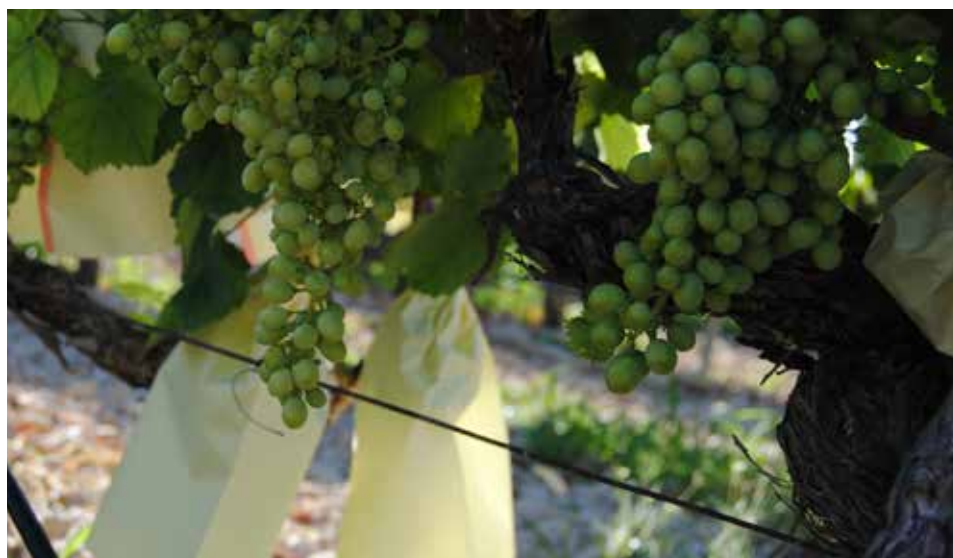
FIGURA 2. Uva de mesa embolsada en Casa Sicilia.