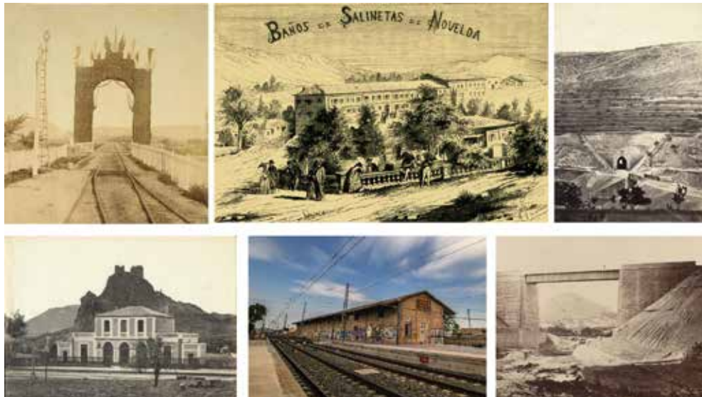
FIGURA 1. Línea MZA y muelle de carga de la estación de ferrocarril de Novelda. Ramiro Verdú. Composición Verónica Quiles y David Beltrá.

La llegada de los trabajadores de la Compañía MZA, luego RENFE, además de los moradores del propio núcleo residencial, junto a las industrias allí establecidas, fueron conformando un barrio con plena actividad que perdura 160 años después. Es importante destacar, que es el único barrio de Estación de la línea Alicante-Madrid en nuestra provincia que tiene vida propia, con una población estable y servicios mínimos y no ha caído en el olvido o abandono como ha ocurrido en otras poblaciones cercanas como Monóvar o Elda. Si cabe, más revitalizado desde 2018 con los trenes de cercanías que unen Alicante y Villena y que posibilitan llegadas y salidas a diario en un amplio horario. Y la propia conexión directa desde la autovía A-31, Madrid-Alicante, salida 213.