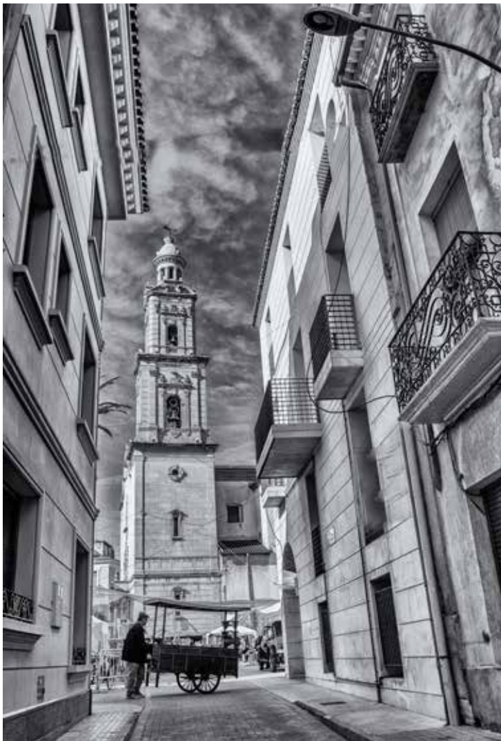
FIGURA 4. Campanario de la iglesia parroquial San Pedro Apóstol. Ramiro Verdú.

En la misma plaza Santos Médicos, próxima a la calle Mayor y posterior a la iglesia parroquial San Pedro Apóstol (fig. 4), encontramos otra singular casa que ocupó durante muchos años la sede de la Caja de