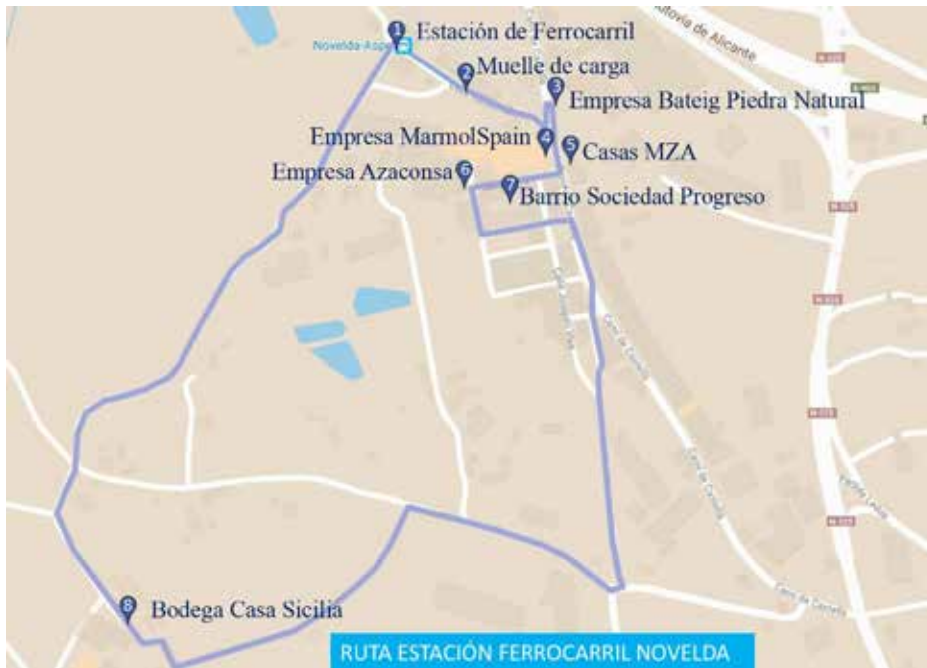
FIGURA 3. Propuesta Ruta Estación Ferrocarril y entorno de Novelda.

y construcción con piedra natural, con un resultado tan propio de la época de la Ilustración.